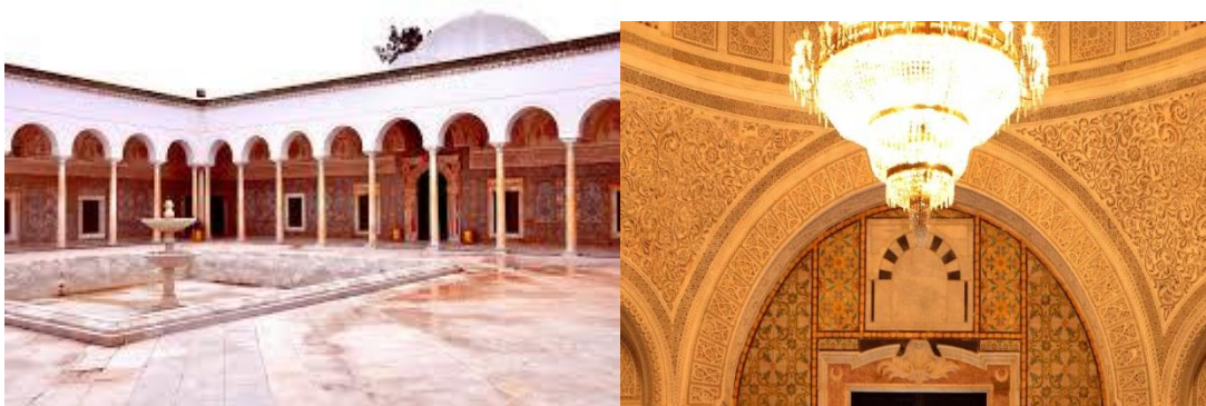
Ksar Warda : Musée militaire national - Le Palais de la Rose

Construit en 1798 sous le règne du bey husseinite Hammouda Pacha (1782-1814), transformé par Sadok Bey en caserne de cavalerie, une de plus grandes merveilles de l'art architectural tunisien connu d'abord par la population sous le nom de "Borj El Kebir" ou Ksar el warda. Pris en charge par le Ministère de la Défense Nationale, le palais recouvra sa splendeur et devient un musée militaire inauguré le 25 juin 1984. Le musée possède de riches et précieuses collections d'objets appartenant à toutes les époques de l'histoire de la Tunisie.